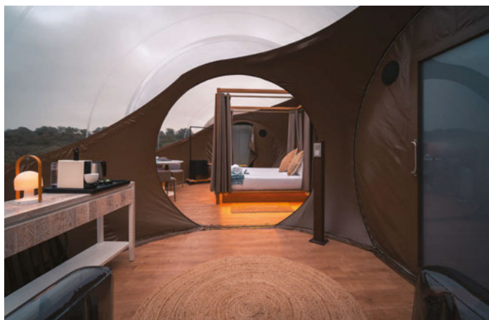
INTERIOR HOTEL MILUNA