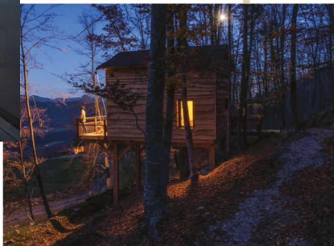
CABANYES ENTRE VALLS